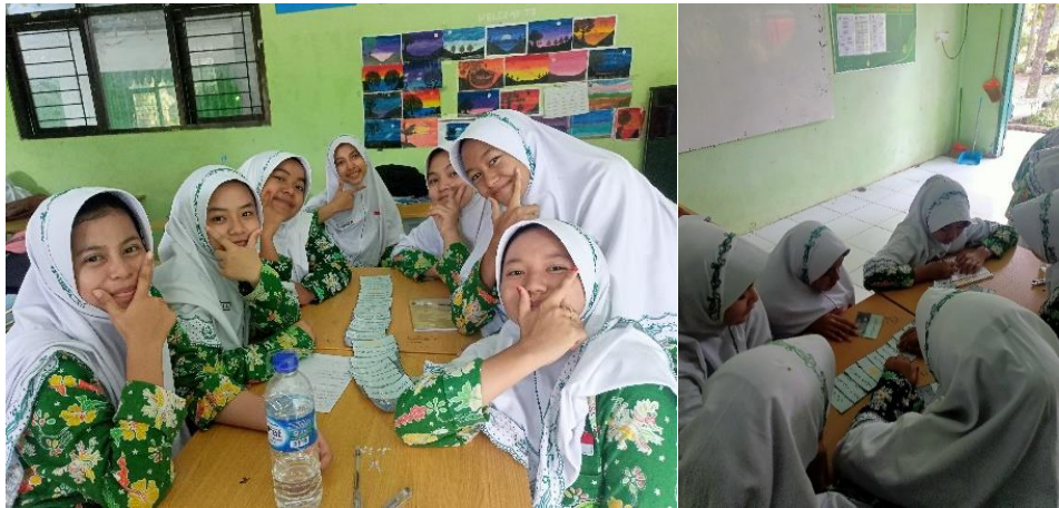
صورة: تطبيق وسيلة بطاقة الدومينو

طريقة الاختبار في هذه الحالة، استخدم الباحث اختبارين. يتم إعطاء هذا النوع من الاختبارات للطلاب في بداية الاجتماع (الاختبار القبلي) يتم إجراء هذا النوع من الاختبارات بهدف معرفة مدى إتقان المادة أو الموضوع المراد تدريسه من قبل الطلاب. واللقاء الثاني (الاختبار البعدي) يتم إجراء الاختبار النهائي بهدف معرفة ما إذا كان الطلاب قد أتقنوا جميع المواد التي تم تصنيفها على أنها مهمة قدر الإمكان. وبناء على البيان أعلاه، يمكن القول إن الاختبار اللاحق يهدف إلى الحصول على بيانات تتعلق بمهارات الكتاب للطلبة في تعلم اللغة العربية بعد تلقيهم العلاج، وهي تطبيق وسيلة بطاقة الدومينو.