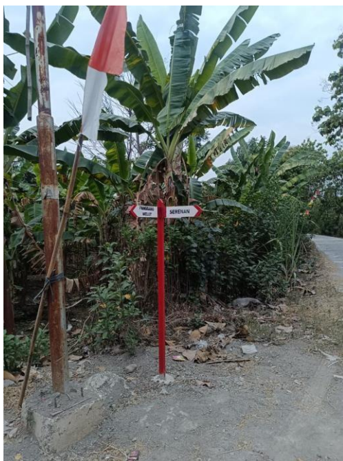
gambar 2 Plang Penunjuk Jalan

Pembuatan plang jalan dan papan selamat datang membutuhkan waktu kurang dari satu minggu pemesanan bahan. Anggota KKN memilih untuk menggunakan jasa tukang kayu yang ada di sekitar Desa Taji. Hal ini dimaksudkan sebagai salah satu promosi UMKM yang ada di Desa Taji. Pembuatan desain papan petunjuk, dibuat untuk menyajikan informasi arah yang jelas dan mudah dipahami. Kemudian, dilakukan perakitan papan menggunakan bahan yang awet dan tahan cuaca, dilanjutkan dengan pengecatan untuk memperindah dan memperjelas tulisan serta simbol. Cat yang digunakan berwarna merah putih agar tulisan petunjuk arah mudah terbaca. Setelah cat kering, baru dilakukan penulisan nama atau simbol arah. Tahap akhir adalah pemasangan papan petunjuk di lokasi yang sudah ditentukan.