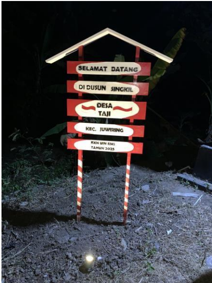
gambar 3 Pemasangan Plang Selamat Datang

Hasil dari program ini adalah tersedianya sarana petunjuk arah yang dapat membantu memudahkan warga desa dan pendatang dalam mencari lokasi sehingga meningkatkan aksesibilitas dan tertib lalu lintas di desa. Program ini juga mendorong partisipasi masyarakat dalam merawat fasilitas desa serta mempererat hubungan antara mahasiswa dan warga desa dalam kolaborasi pembangunan. Secara keseluruhan, program pembuatan petunjuk arah jalan desa ini menjadi kontribusi nyata dalam upaya pengembangan dan pelayanan publik di tingkat desa.