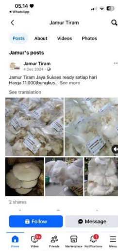
Gambar 2 Akun Facebook