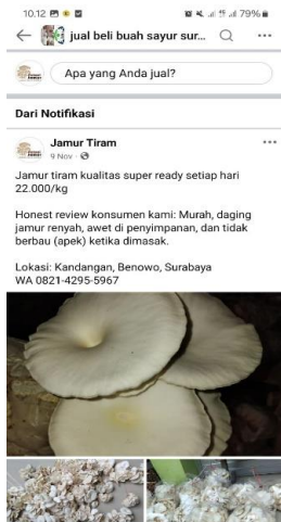
Gambar 3 Bergabung di grup Facebook Gambar 4 WhatsApp Bussines

Dari Gambar sosial media diatas terlihat bahwa beberapa sosial media tidak aktif, menurut Bu Dinda sosial media tersebut tidak aktif karena tidak adanya yang mengelola akun tersebut. Akun Instagram seharusnya dimanfaatkan sebagai media visual utama untuk mempromosikan produk